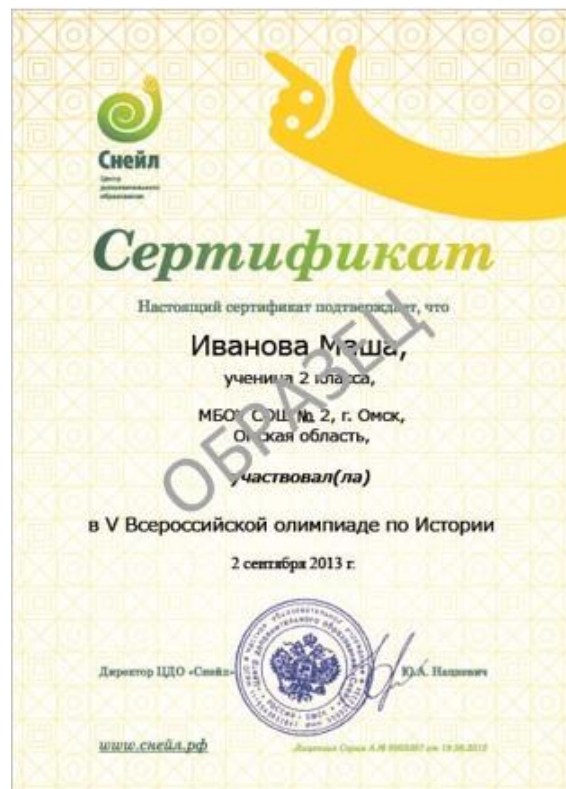
Образец Сертификата участника