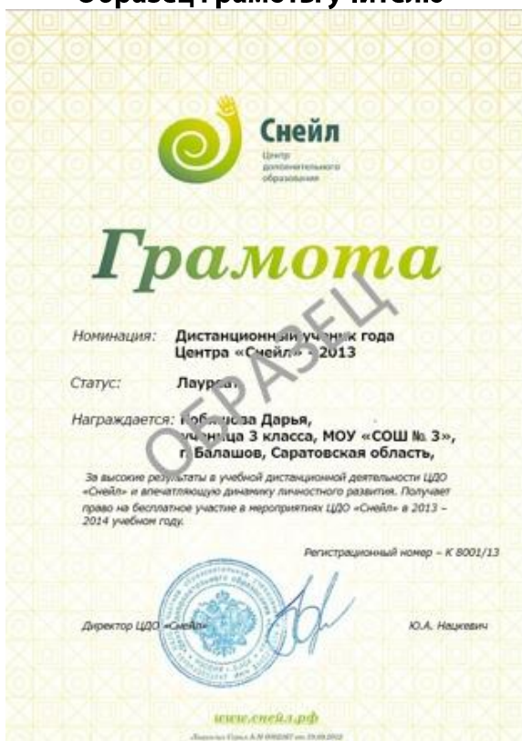
Образец грамоты по итогам внутренних конкурсов