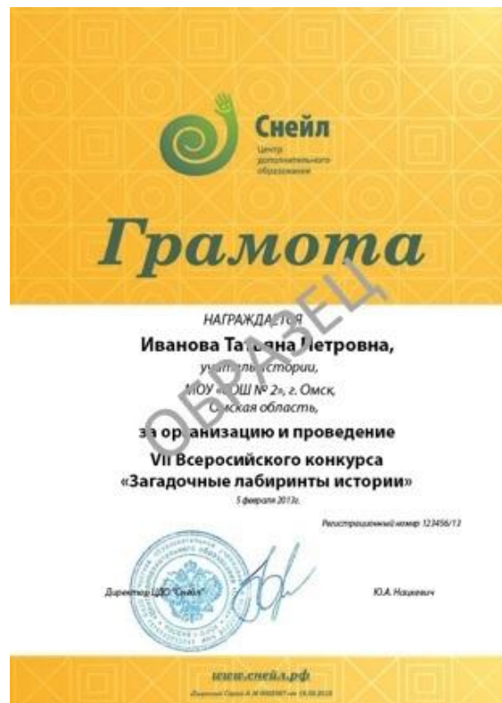
Образец Грамоты координатора