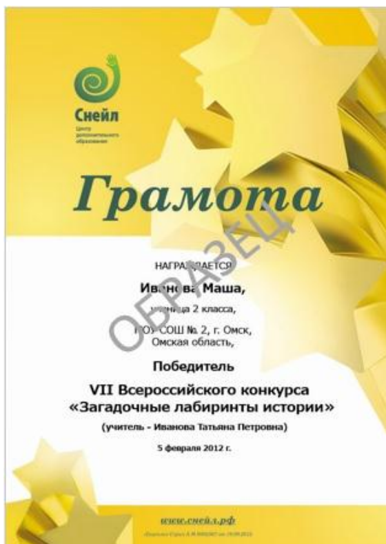
Образец Грамоты ученику за призовое место

1. Приказываю утвердить наградные материалы на 2013-2014 учебный год: